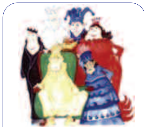
Teatro Verde "C'era 5 volte un re" Regia di Carlo Conversi

Un'amicizia che la vita ha tradito e la morte ha spezzato.